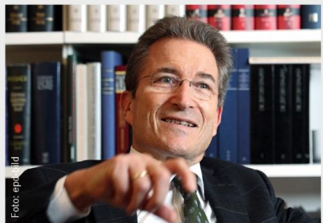
DR. WOLFGANG HUBER, BERLINER ALTBISCHOF UND EHEMALIGER RATSVORSITZENDER DER EVANGELISCHEN KIRCHE IN DEUTSCHLAND (EKD)

» Gott öffnet uns die Augen für unsere Mitmenschen und hilft uns dabei, Mitmenschen als gleichberechtigt anzuerkennen und – soweit wir irgend können – auch als gleichberechtigt zu behandeln. Das ist für mich die Aktualität der Reformation. Und das ist nur schwer zu überbieten.