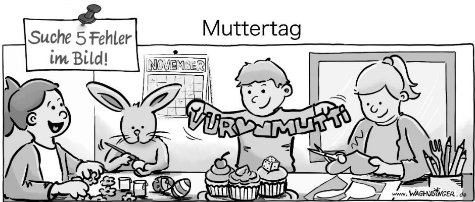
Osterhase, "November", "Vur", "Wür", "Wüffel", Gabel

Die Teilnehmekosten für Programm und Verpflegung betragen 10 €