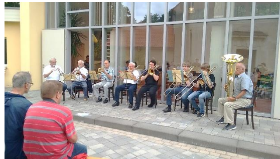
Posaunenchor Gemeindefest 2016