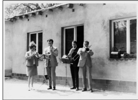
Posaunenchor Ostern 1970

Zum Anlass des 50. Jubiläums des Posaunenchores wird er den Gottesdienst am 29. April 2018 mit viel Bläsermusik ausgestalten. Dazu laden wir recht herzlich ins Gemeindezentrum Halle-Neustadt ein.